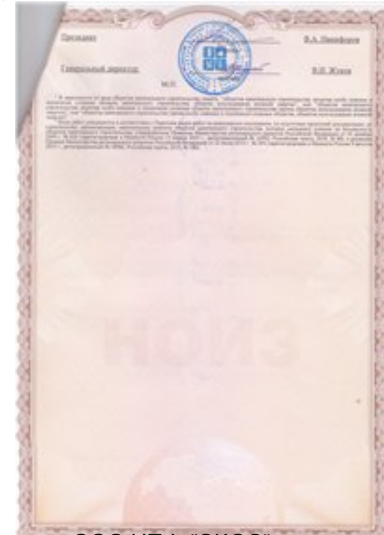
ь" на участке в Зауралье по процедуре аккредитации ОАО "Нефтяная Компания "Роснефт